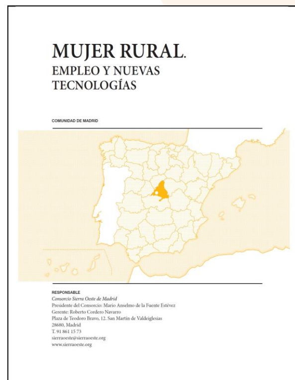
Portada General de la Guía (a la izquierda) y Portada del capítulo dedicado al proyecto Mujer Rural. Empleo y Nuevas Tecnologías (A la derecha).